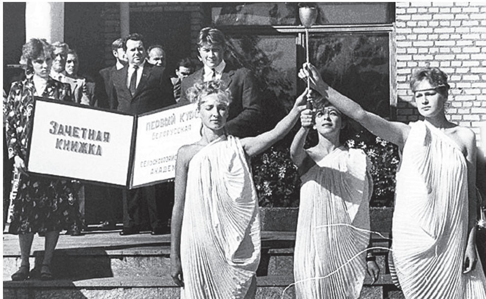
1 сентября на ритуальной площади напротив учебного корпуса №10 зажигается огонь знаний (1991 г.)

В том же году с целью пропаганды традиционной белорусской культуры в академии был создан молодежный клуб «Спадчына».