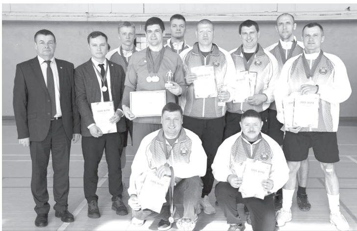
социальных связей, формированию здорового образа жизни и поддержанию позитивного настроения.

Спартакиада прошла в лучших традициях профсоюзного движения: весело, ярко и с пользой для здоровья. Участники не только продемонстрировали свои спортивные таланты, но и укрепили командный дух, обменялись опытом и просто хорошо провели время в кругу единомышленников. Такие мероприятия играют важную роль в жизни трудовых коллективов, способствуя не только физическому развитию, но и укреплению