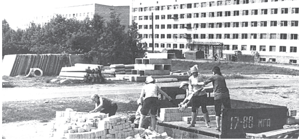
Строительство студенческого общежития №8 (1970-е гг.)