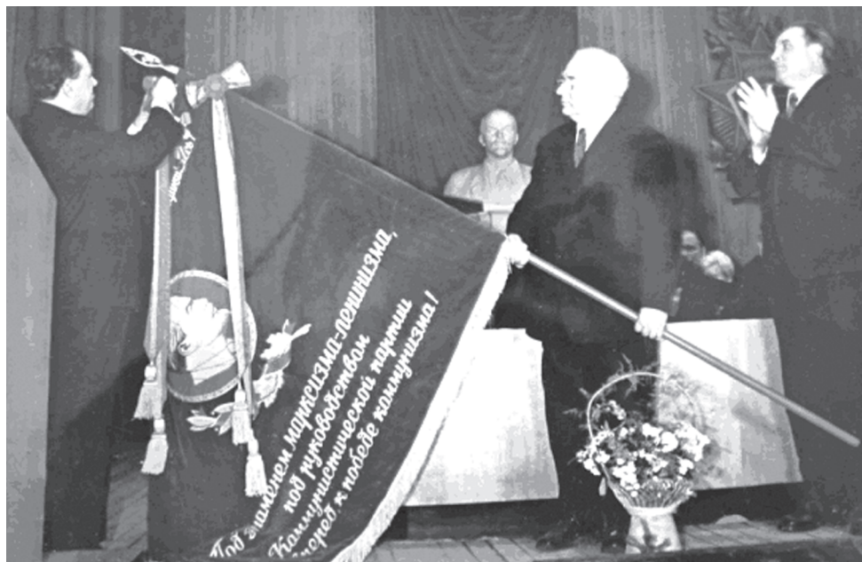
Прикрепление орденской ленты на знамя академии (1976 г.)

В 1975 г. была осуществлена реконструкция памятника на братской могиле подпольщиков и жертв фашизма, произведено перезахоронение погибших и благоустройство территории. В центре экспозиции – скульптура «Скорбящей матери», на постаменте надпись: «Перед памятью тысяч погибших, живые, головы склоните!». 9 мая состоялось торжественное открытие мемориала. В 2009 г. после очередной реконструкции памятника были установлены плиты с фамилиями жителей Горецкого района, погибших в годы Великой Отечественной войны. В 2021 г. на территории братской могилы подпольщиков и жертв фашизма был торжественно открыт памятный знак «Детям войны».