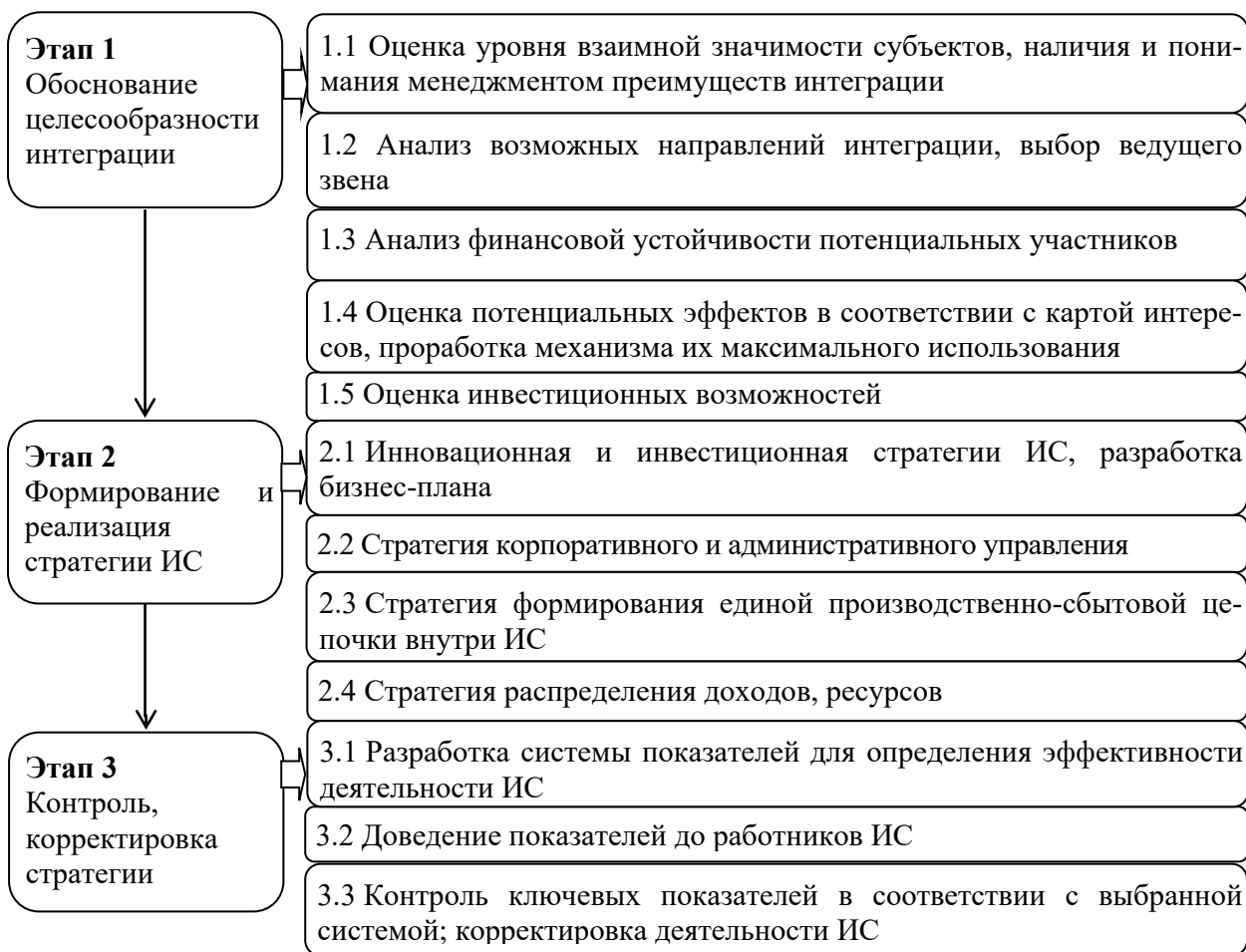
Рисунок 4 – Алгоритм разработки стратегии эффективного функционирования ИС

Разработанный алгоритм стратегии эффективного функционирования ИС представляет собой поэтапность мероприятий, заключающихся в обосновании целесообразности интеграции, формировании и реализации соответствующей стратегии, а также ее контроле и при необходимости корректировке (рисунок 4).