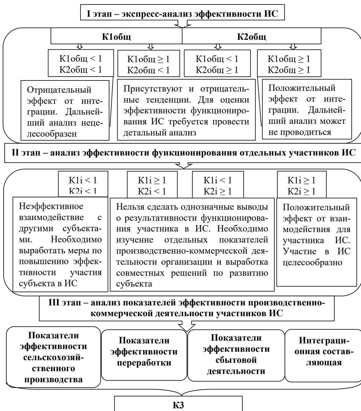
Рисунок 2 – Методика поэтапной оценки эффективности деятельности ИС в аграрном бизнесе

Примечание – Рисунок выполнен автором на основе собственных исследований. K1_{общ} и K2_{общ} – общие коэффициенты, отражающие эффективность ИС в сравнении со средней по стране (области, району) и в динамике. K1_i и K2_i – коэффициенты, отражающие эффективность i -го участника ИС в сравнении со средней по формированию и в динамике, i – количество субъектов, входящих в состав ИС. K3 – интегральный коэффициент, отражающий эффективность производственно-сбытовой деятельности ИС в сравнении с базисным периодом (до интеграции). Рассчитывается по блокам: сельскохозяйственное производство, переработка, торговля, интеграционный блок.