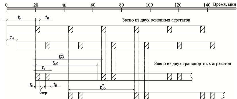
Рис. 3.1. График согласования работы уборочно-транспортного звена:

что полностью соответствует аналитическому выражению (3.10).