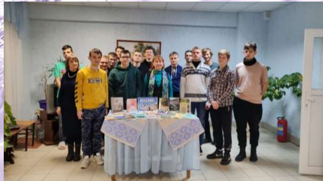
Литературно-музыкальная композиция «Акадэмія – песня матчына...». Общ. №4 БГСХА. Декабрь 2023 г.