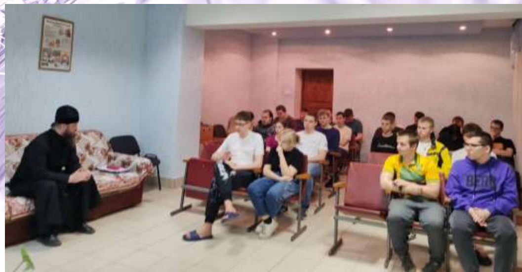
Православный час «Духовность и ценности современной молодёжи». Общ. №4 БГСХА. Ноябрь 2023 г.