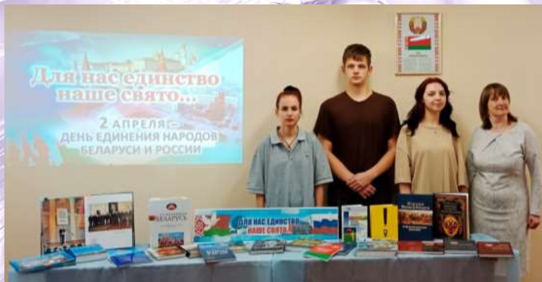
Литературный час «Для нас единство наше свято...» посвящённый Дню единения народов Беларуси и России. Общ. №4 БГСХА. Апрель 2024 г.