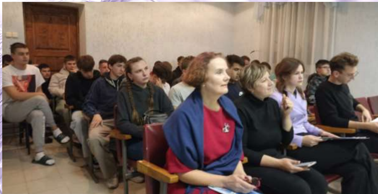
Литературная композиция «Любовью материнской мы согреты», посвящённая Дню матери. Общ. №4 БГСХА. Октябрь 2023 г.