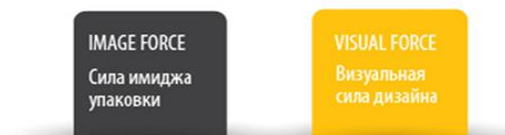
Рис. 1. Методика тестирования упаковки

Материалы и методика исследования. В процессе исследования использовалась модифицированная инновационная специальная методика, разработанная компанией Package Testing Lab (рис. 1).