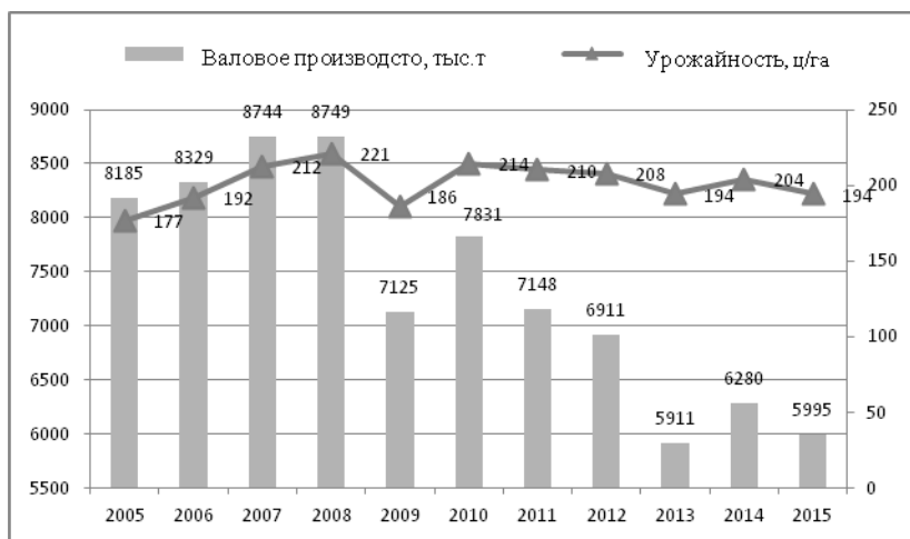
Рис. 1. Валовое производство и урожайность картофеля (2005–2015 гг.)

Таким образом, картофелеводческая отрасль республики потеряла значимые позиции на внешнем рынке и сократила объемы производства, при этом заметен значительный рост урожайности в период с 2005 по 2015 гг., составив при этом в динамике 15,25 % (рис. 1).